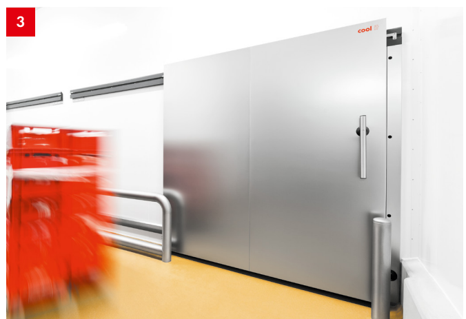
3 CI8 handbediente Schiebetür mit Abdruckhebel für Kühlräume