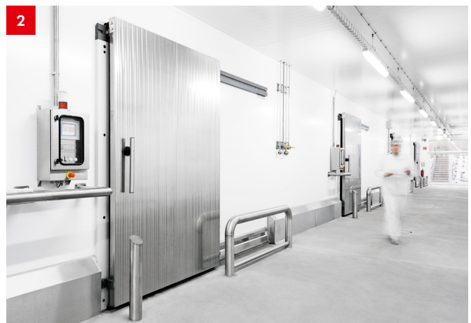
1 CI8 Schiebetür mit Griffstange für Kühlräume (Automatikausführung)